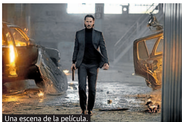
Una escena de la película.